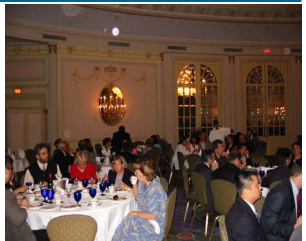
Salle comble au Salon ovale du Ritz Carlton Conférence sur la Dollarisation - 27 juin 2002